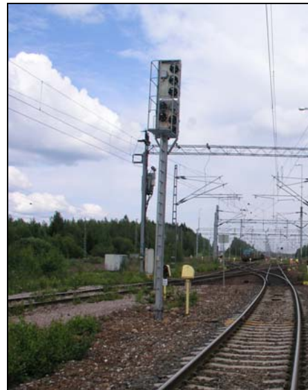
Kuva 2. Neliöputkinen opastinmasto