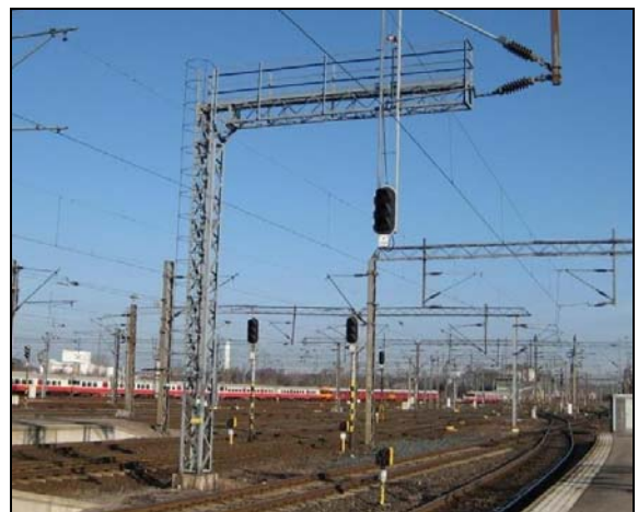
Kuva 4. Ulokeportaali