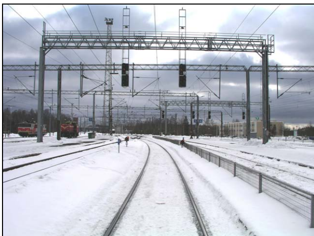
Kuva 3. Opastinportaali