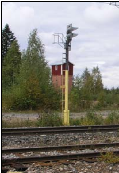
Kuva 1. Pyöreäputkinen opastinmasto