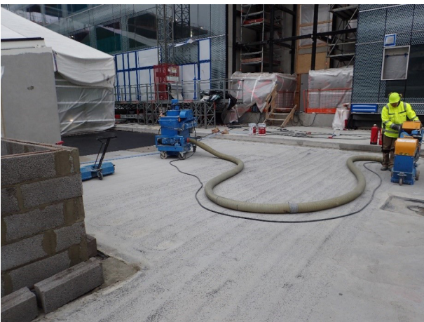
Kuva 12. Eristysalustan puhdistus sinkopuhdistuksella.

Veden virtausta estävät tai vedeneristystä vaurioittavat harjanteet ja nystyrät hiotaan pois. Painanteet, kolot ja muut paikalliset vauriot voidaan täyttää juotosmassalla (kuumuutta kestävä epoksin ja hiekan seos, kuva 13) tai juotolaastilla SILKO-ohjeen 2.231 /7/ mukaan. Jos paikkaus tehdään juotosmassalla, sitoutumattomaan pintaan sirotellaan kuivaa hiekkaa. Jos pinnan muotoilu on hankalaa, kuivatus voidaan järjestää tekemällä suppilolla varustettu tippuputki painanteen alimpaan kohtaan (vesi ei saa valua alapuolisille rakenteille tai kulkuteille).