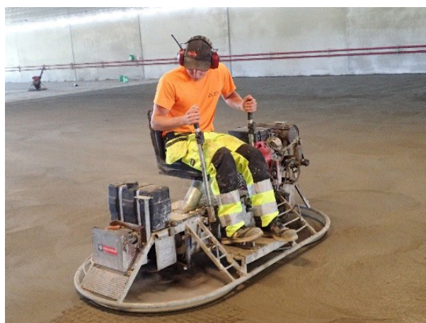
Kuva 9. Pinta hierretään heti, kun muotoiluvalu kantaa koneen.