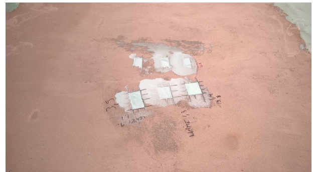
Kuva 13. Epoksihiekkapaikkaus.

Viettokaltevyyden riittävyys tarkistetaan oikolaudalla