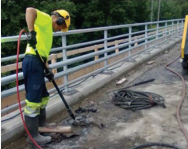
Kuva 10. Vanha kermieristys poistetaan petkeleellä.