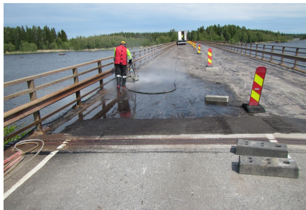
Kuva 6. Kannen tasovesipesua.

Vesipiikkaus ja tasojyrshintä aloitetaan mallityöllä. Vesipiikkausta varten määritetään paine, vesimäärä ja suutin. Jyrshintää varten määritetään jyrshintäsyvyys ja jyrshintämenetelmä. Jos työmenetelmää joudutaan muuttamaan, tehdään uusi mallityö, jonka tilaaja hyväksyy. Piikkausjäte tulee poistaa välittömästi ja samalla seurataan piikkaussyvyyden vaihtelua ja mahdollisesti esiin tulevia raudoitustankoja.