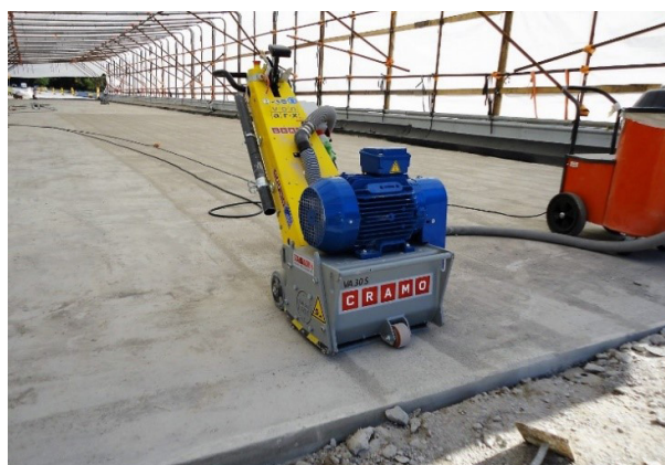
Kuva 5. Ohuen pintakerroksen poistamiseen sopiva jyrshintä.