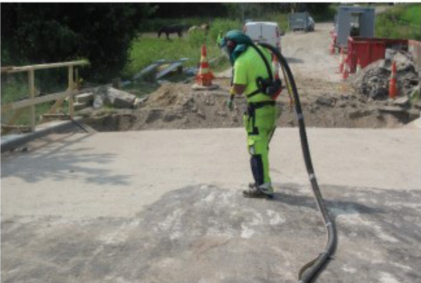
Kuva 11. Eristysalustan suihkupuhdistusta hiekkapuhalluksella.