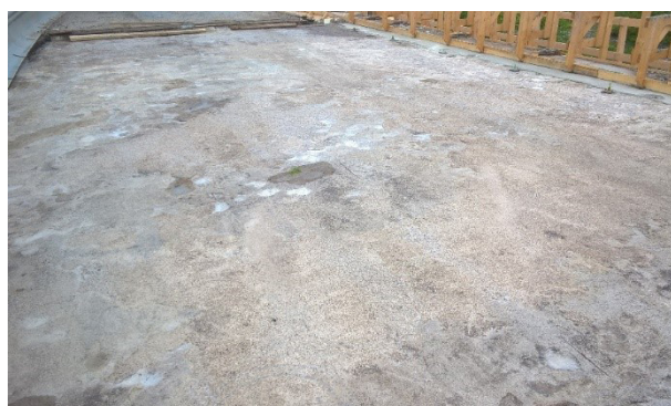
Kuva 2. Painanteita eristysalustassa.

Vedeneristyksen alustan korjaustarvetta voidaan arvioida Sillantarkastuskäsikirjan /1/ taulukoiden 1b, 2, 3 ja 6 mukaan.