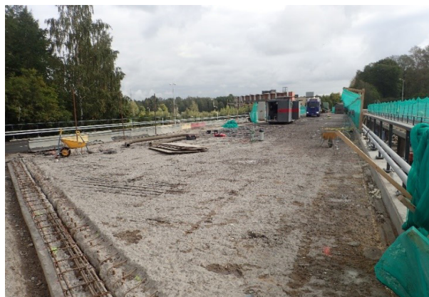
Kuva 4. Kansilaatan yläpinta vesipiikkauksen jälkeen.