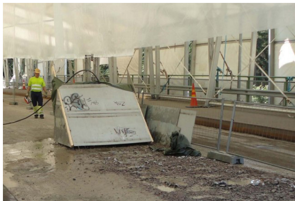
Kuva 3. Kansilaatan vesipiikkausta.