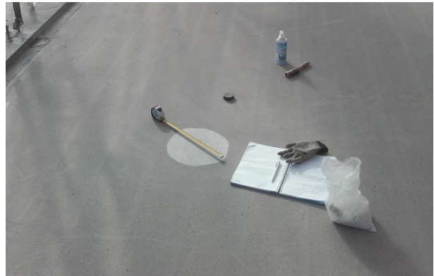
Kuva 14. Eristysalustan karheuden määrittäminen lasihelmimenetelmällä.

Laaturaportti luovutetaan tilaajan edustajalle viimeistään vastaanottotarkastuksessa.