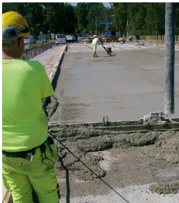
Kuva 8. Betonimassa tiivistetään tärypalkilla.

Muotoiluvalun kutistumahalkeilua voidaan myös estää poikittaissaumoilla. Suunnittelija määrittää kutistumasaumojen tarpeellisuuden valun paksuuden ja pinta-alan perusteella