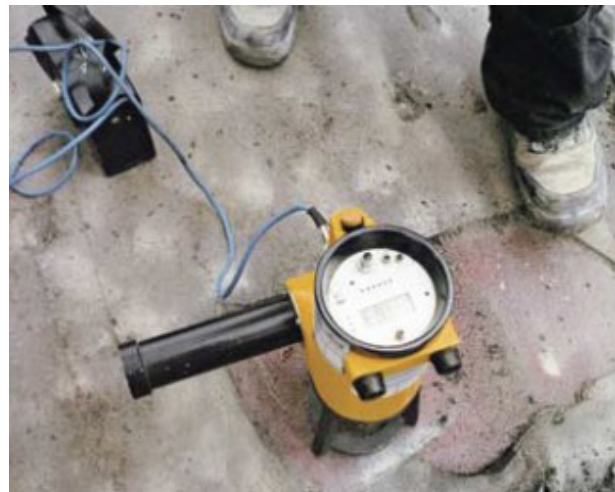
Kuva 15. Tartuntavetokoe.