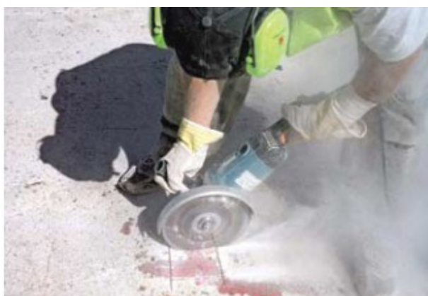
Kuva 7. Pienen paikkauksen rajausta.

Pienet kohteet piikataan kevyellä tai keskiras-kaalla piikkausvasaralla siten, että irtonaista tai rapautunutta betonia ei jää rakenteeseen. Piikkatun pinnan pitää olla karkea. Piikkattava osa rajataan yleensä suoraviivaiseksi käsihiomakoneen katkaisulaikalla tehtävän uran avulla (kuva 7).