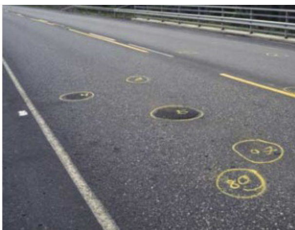
Kuva 1. Höyrystyneen kosteuden aiheuttamia kuplia päällysteessä.