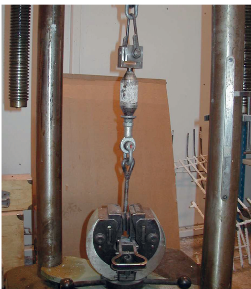
Kuva 1. Betonin vetolujuuden testaus.