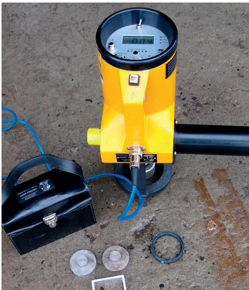
Kuva 4. Eristysalustan tiivistyksen tartuntavetomittaus.

Tämän ohjeen liitetaulukossa 3 esitetään testausorganisaatioita, jotka tekevät eristys- tai tiivistysalustan, betonipinnan tiivistyksen ja vedeneristyksen sekä päällysteen testauksia. Testauksia voidaan tehdä sekä silta- ja muiden taitorakenteiden korjaustöissä että uusien rakenteiden rakentamisen yhteydessä, kun