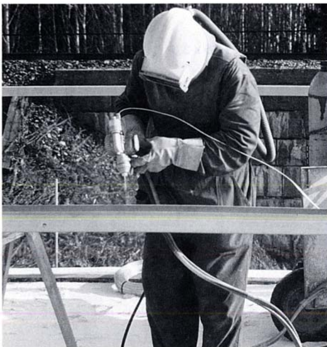
Kuva 2. Kaiteen ruiskusinkitystä siltapaikalla.

Tässä ohjeessa esitetään metallisia pinnoitteita kuten kuuma- ja ruiskusinkityksiä tekevät laitokset ja urakoitsijat.