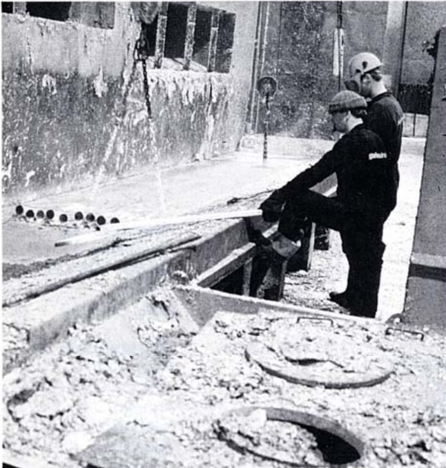
Kuva 1. Kappaleiden kuumasinkitystä laitoksessa.